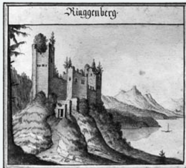
Die Burg von Westen vor dem Einbau der Kirche. Albrecht Kauw, um 1660. Bernisches Historisches Museum.

Die Bauarbeiten am ostseitigen Turm blieben auf ca. 6 m Höhe über einer mächtigen Balkenlage stecken. Das Fehlen von